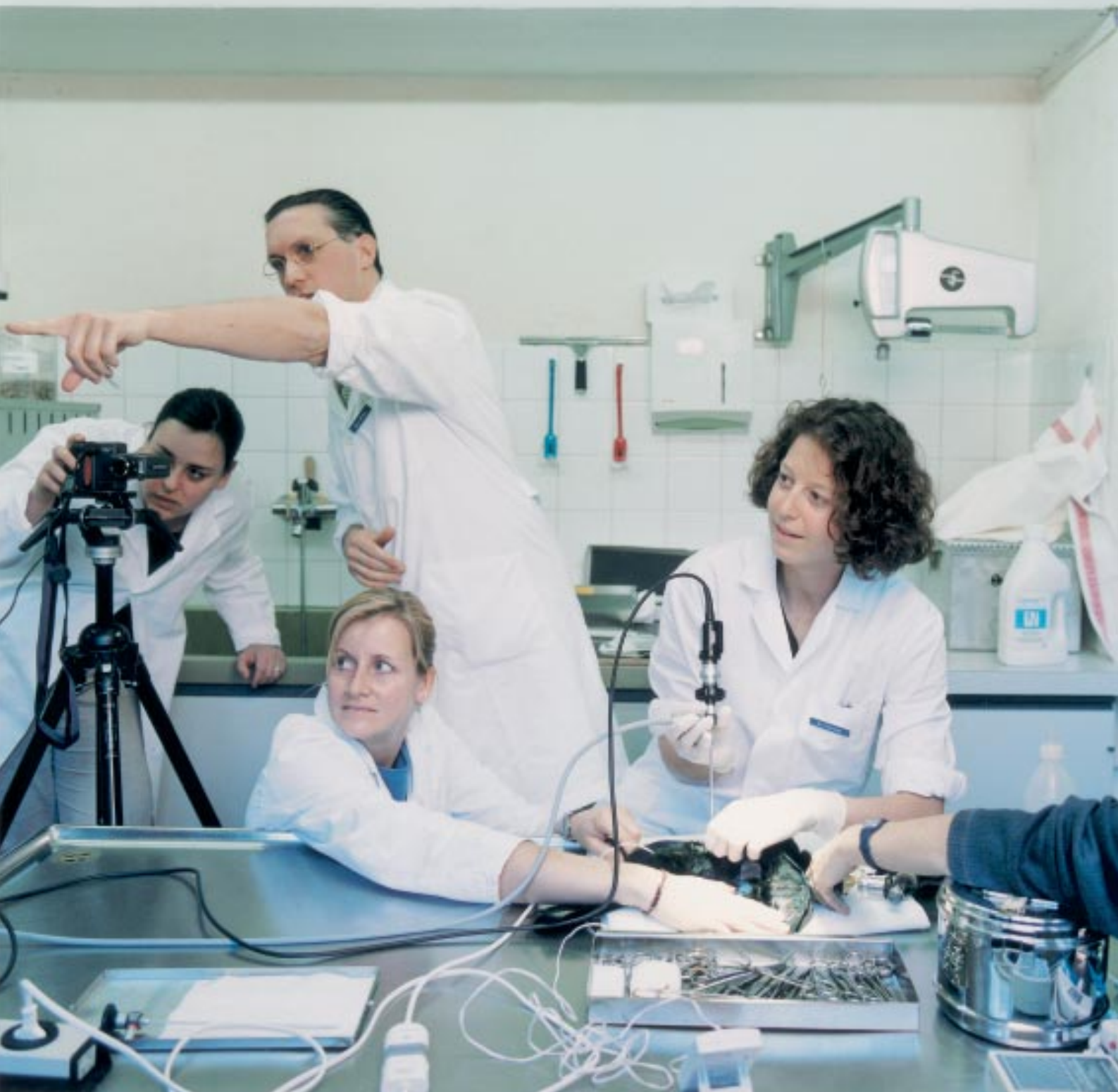
Hôpital vétérinaire de Zurich: détermination du sexe d'un oiseau exotique par endoscopie www.vet.unizh.ch/institute/tierspital.html