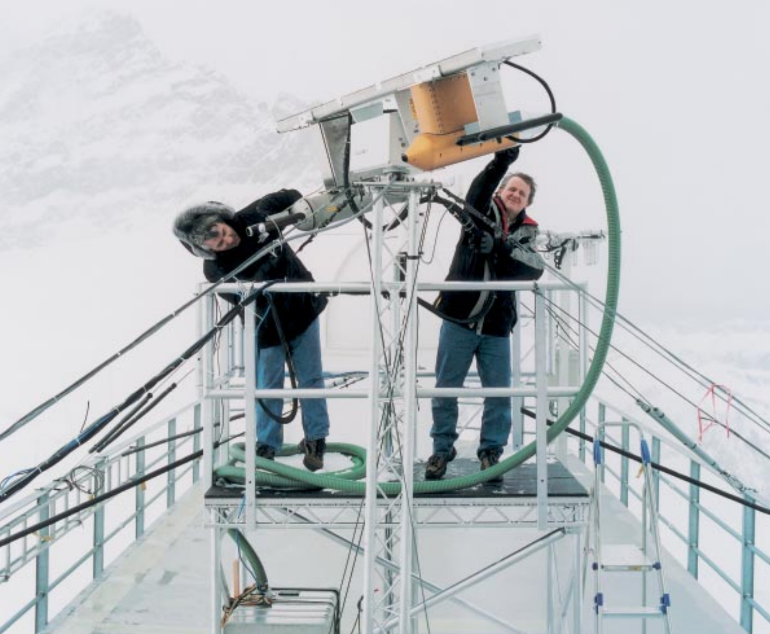
Centre de recherche de haute montagne du Jungfraujoch: appareil à grande vitesse pour photographier des flocons de neige www.ifjungo.ch/200jung.html