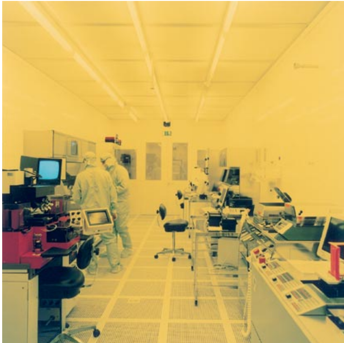
EPF Lausanne: fabrication de micro-systèmes par photolithographie cmi.epfl.ch