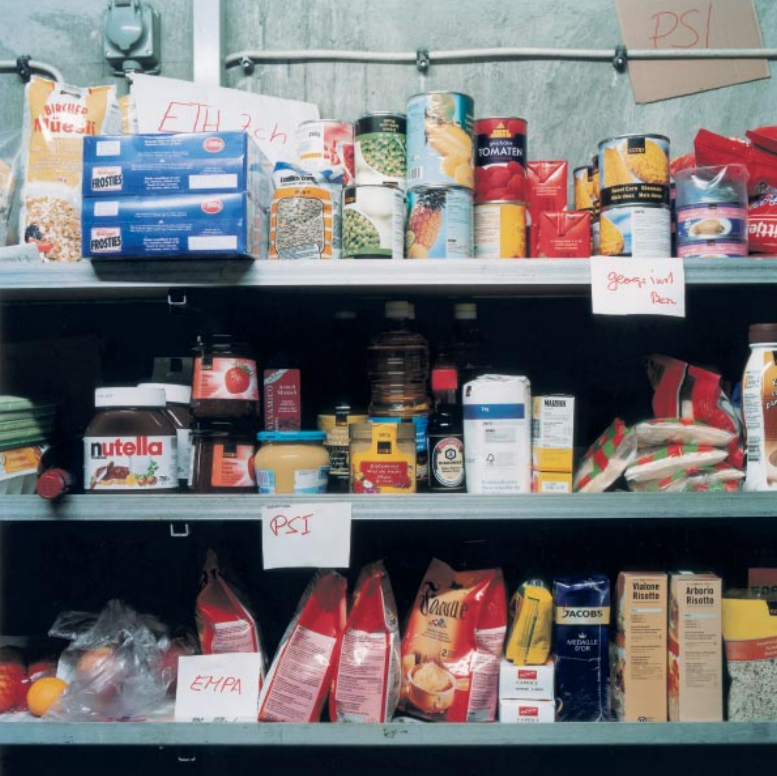
Centre de recherche de haute montagne du Jungfrauojoch: réserves alimentaires des équipes de recherche www.ifjungo.ch/200jung.html