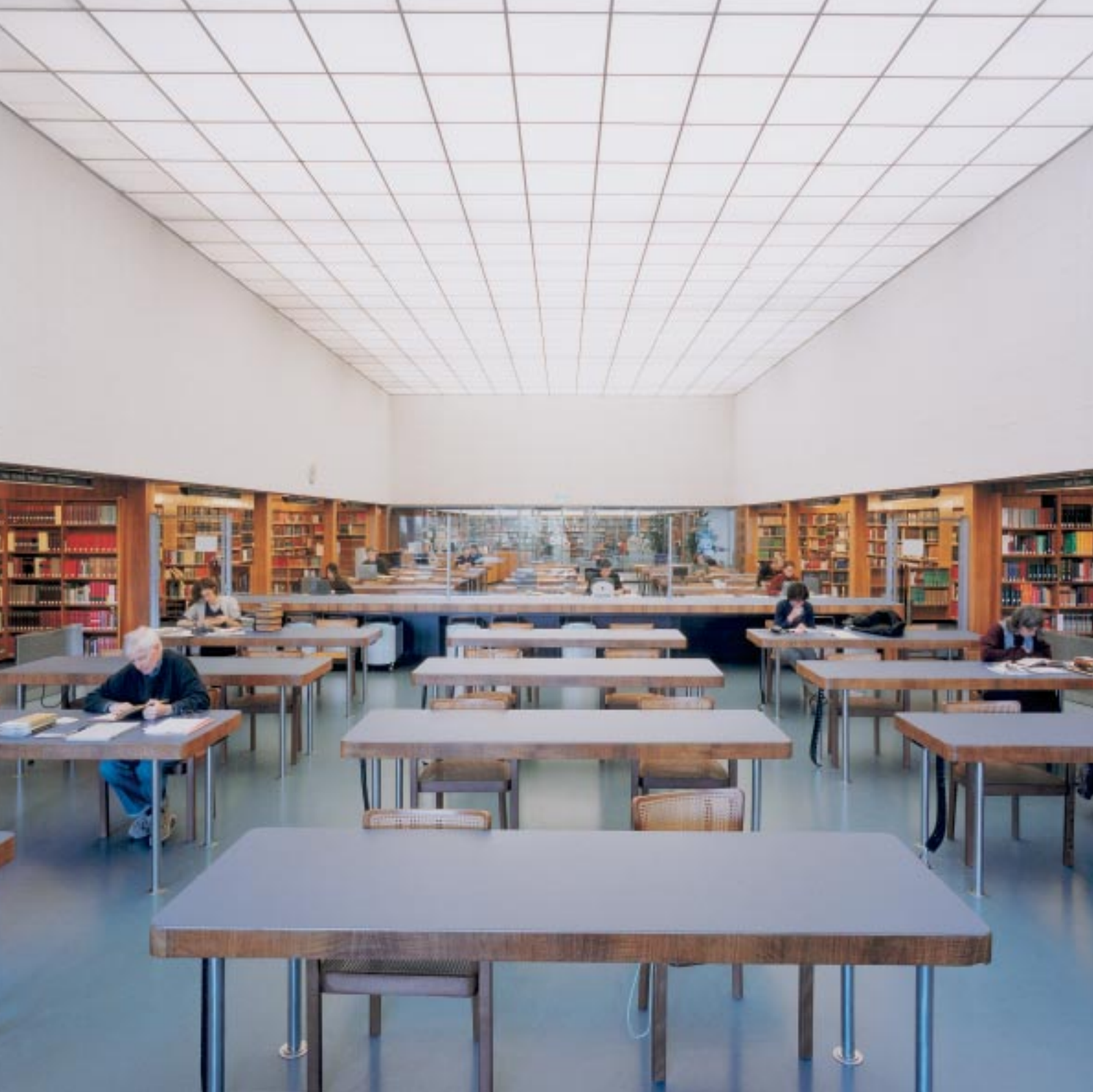
Bibliothèque nationale suisse à Berne: salle de lecture www.snl.ch