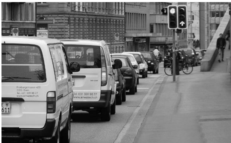
Si les objectifs de réduction ne sont pas encore atteints, ils sont en voie de l'être grâce aux mesures volontaires.

■ économiquesuisse continue d'apporter son soutien à la loi