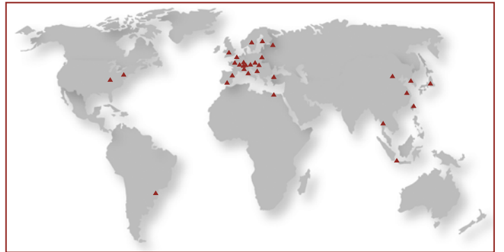
La carte indique les filiales de STAR Group à l'échelle mondiale.

aux clients de STAR dans le domaine de la traduction technique.