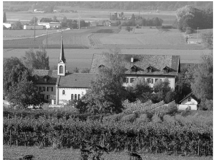
Le quartier général de STAR Group se trouve dans un lieu idyllique proche de la frontière allemande.

Des programmes professionnels comme Transit, l'outil de traduction qui se fonde sur les connaissances sauvegardées par le client, TermStar, le programme de terminologie qui veille à l'uniformité et à la précision, WebTerm, l'outil qui permet à toute entreprise de rendre accessible sa terminologie sur Internet ou l'intranet, STAR JamesTM, le gestionnaire du processus de traduction, ainsi que GRIPS et SPIDER, les logiciels permettant d'administrer, d'entretenir et de publier des informations donnent de vastes possibilités