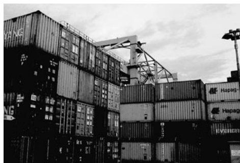
Une modernisation de la GRE renforcerait notre économie d'exportation.

IV. La loi étant justement une loi-cadre svelte, c'est dans l'ordonnance d'application que seront concrètement traduits les principes directeurs de la loi et que seront définies d'importantes conditions matérielles de mise en œuvre de la nouvelle assurance. Il est dès lors nécessaire que les branches directement concernées soient étroitement