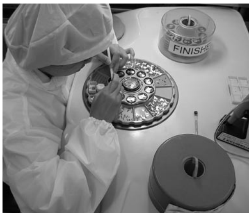
Une collaboratrice de la firme Ronda (succursale en Thaïlande) termine des mouvements de montres électroniques.