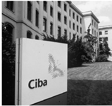
L'espace Klybeck de Ciba Spécialités chimiques à Bâle.

processus industriel. Cet approvisionnement en chaleur se fait à 11 bar vapeur. Dans la centrale de chauffage, la chaleur de confort est distribuée sous forme d'eau chaude à 70°C à l'aller et à environ 40°C au retour aux consommateurs (boiler, radiateurs, etc.). Le produit de condensation est récolté et dirigé à des températures de 60°C à 105°C dans le réseau de condensation de l'usine. L'exploitation ayant été optimisée, il est désormais possible d'utiliser le condensé thermique de tout l'entrepôt. Il passe par un échangeur thermique qui élève la température de retour du circuit de chaleur. Le condensat est ainsi ramené à une température inférieure à 50°C. Cette amélioration de l'installation s'est faite avec des éléments existants, et donc à un prix avantageux. Les coûts variables de l'énergie mise en circulation se montent à environ 40 francs/MWh. L'investissement total se monte