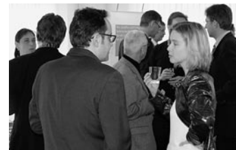
Discussion animée et échanges d'idées à l'heure de l'apéro.