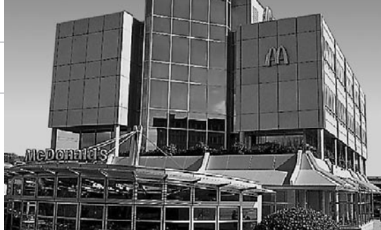
Siège de McDonald's Suisse à Crissier VD.