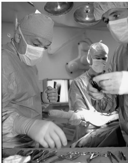
La Suisse doit imaginer de nouvelles pistes en matière d'accès à la profession de médecin.

Le moratoire est une mesure de politique de la santé problématique. Les chiffres sur lesquels le Conseil fédéral et les cantons se sont appuyés pour décréter cette mesure étaient imprécis. Rien n'indique jusqu'ici que cette disposition ait contribué à la stabilisation souhaitée du nombre des médecins et freiné les coûts dans le secteur ambulatoire. Compte tenu du fait que la validité de la mesure est limitée à trois ans et que les médecins avaient suffisamment de temps entre son annonce et sa mise en oeuvre pour déposer leur demande d'admission,