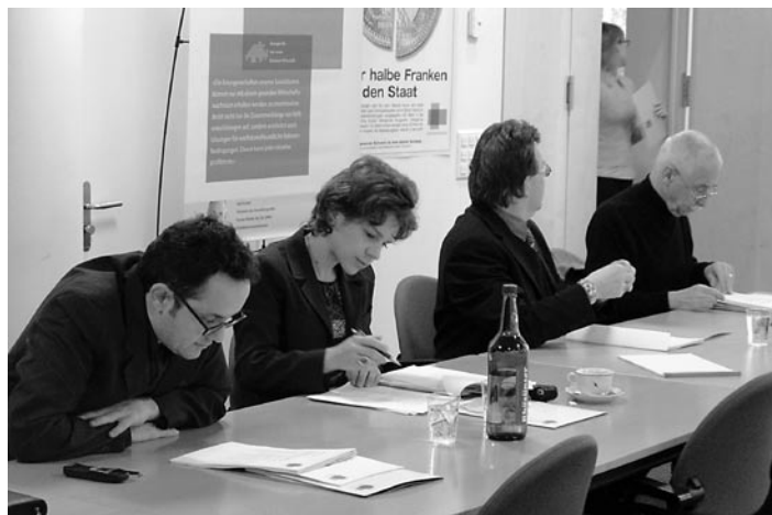
Les journalistes à l'étude des faits.

Certains milieux ont critiqué violemment le Concept des dépenses. Pourtant, les craintes qu'il exprimait à l'époque se sont avérées. Le récent dossier sur l'évolution des dépenses globales de l'Etat entre 1999 et 2002 révèle que les dépenses publiques auraient mérité un «carton rouge» depuis longtemps. En passant de 150 à près de 170 milliards de francs, les dépenses ont augmenté de 20 milliards de francs, le double de la croissance économique pendant la même période. Cette évolution ne peut pas continuer.