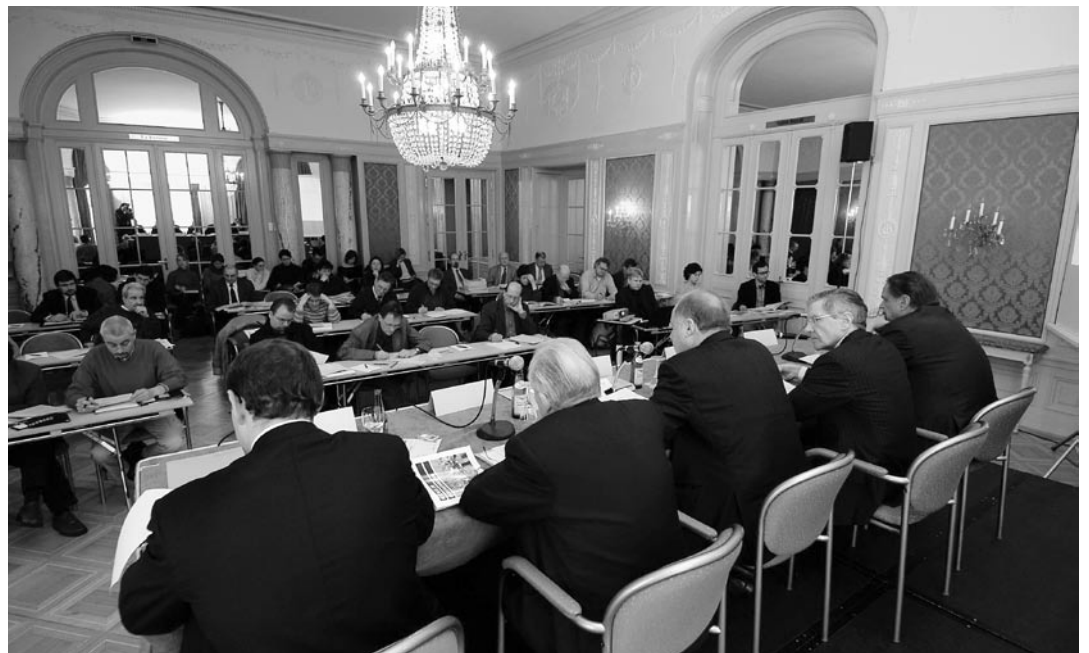
Grosse affluence à la conférence de presse

Diverses hautes écoles et certains secteurs spécialisés en Suisse jouissent toujours d'une forte position internationale. Le nombre des étudiants est en forte hausse, ce qui est en soi réjouissant, mais en même temps, le système a révélé ses faiblesses. Dans de nombreuses disciplines, les conditions d'encadrement sont devenues insupportables. D'une manière générale, on peut dire que l'enseignement du troisième degré en Europe souffre essentiellement d'un problème au niveau des enseignants et de l'encadrement par rapport aux hautes écoles anglo-saxonnes qui, elles, sont bonnes. Si l'on veut appliquer avec succès la déclaration de Bologne, il faudra absolument parvenir à mieux encadrer les étudiants. Cela passe par une augmentation significative du nombre des enseignants. Et pour accroître ces effectifs, il faut disposer des moyens appropriés. Vu la situation financière précaire des collectivités publiques, l'Etat ne peut pas à lui seul les fournir; il faut plutôt s'interroger sur la contribution que les étudiants peuvent apporter à un système dont ils sont les principaux bénéficiaires et dont les taxes d'études ne couvrent que 3% des charges. L'augmentation des