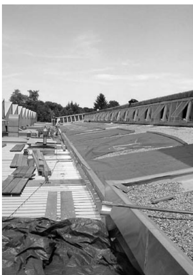
Assainissement du bâtiment de Lista SA: l'isolation du toit et les nouveaux éclairages permettent de réaliser des économies d'énergies thermique et électrique.