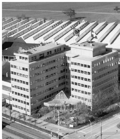
L'entreprise Lista SA d'Erlen est l'une des dix entreprises constituant le groupe thurgovien du Modèle énergétique. Issue d'une longue tradition, l'entreprise familiale est un symbole mondial pour les équipements d'exploitation, les installations de stockage et les fournitures de bureau.