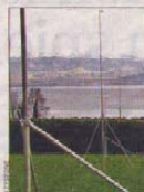
Der neue Europasitz in Rolle: Volvo baut auf die Schweiz.

Dech dahinter verbirgt sich ein klarer Trend: Immer mehr internationale Unternehmen zeigen ihre regionalen oder gar globalen Headquarter in die Schweiz. «Der Denk- und Werkplatz sowie der Dienstleistungsstandort Schweiz profitieren ganz klar von der interna-