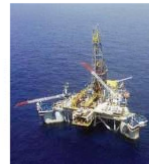
Bald schweizerisch: Erdölplattform der Noble Corporation im Golf von Mexiko.

Von Ralph Pöhner. Aktualisiert um 15:01 Uhr 6 Kommentare Die Absetzbewegung aus der Karibik geht weiter, ein amerikanischer Konzern nach dem anderen zieht mit seinem Hauptsitz in die Schweiz: Dies ist ein Nebeneffekt des Drucks auf die Steueroasen. Oder wird es zum Bumerang?