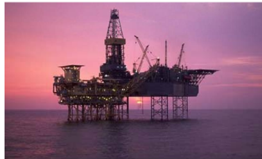
Baar statt Cayman Islands: Der Ölkonzern Noble zieht um in die Schweiz.